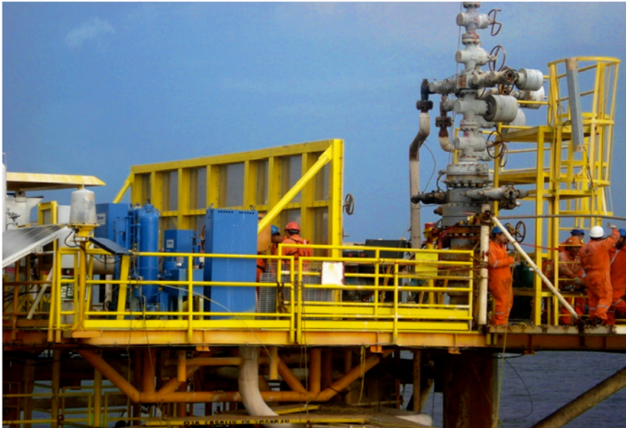
Une paroi séparative DuraBlast protégeant le tableau de commande.