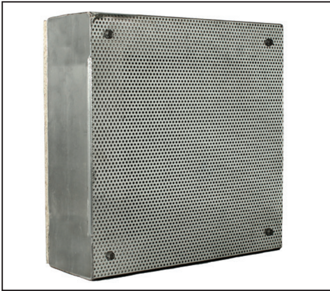
El lado perforado del panel de absorción.