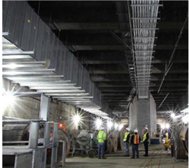
Instalación grande de DuraDuct HP en una red de metro.