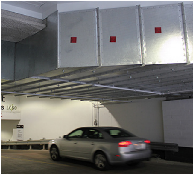
Cámara de DuraDuct HP.