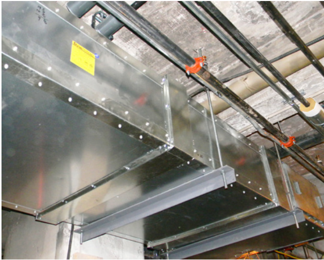
Installation d'un DuraDuct KEX