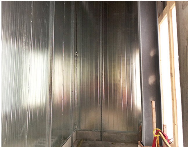
Cámara de aspiración de DuraTherm.