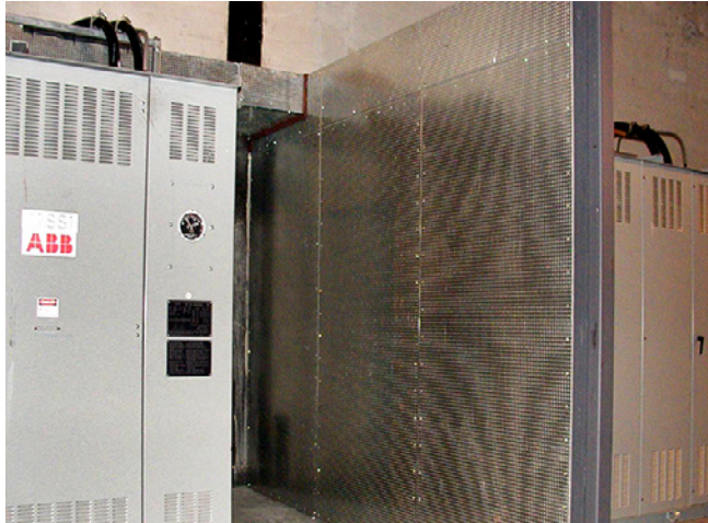
Un muro cortafuego que separa dos cajas protectoras de equipos eléctricos.