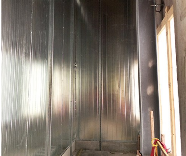
Plénium d'admission DuraTherm™.