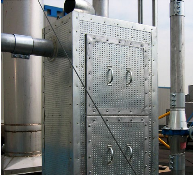
Una caja protectora contra explosiones para equipos en una azotea.